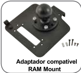
Adaptador compatível RAM Mount