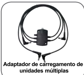
Adaptador de carregamento de unidades múltiplas