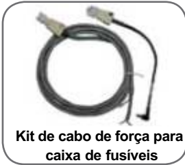
Kit de cabo de força para caixa de fusíveis