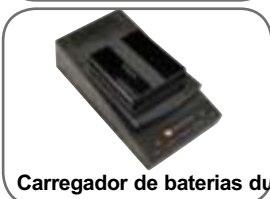
Carregador de baterias duplo