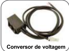
Conversor de voltagem